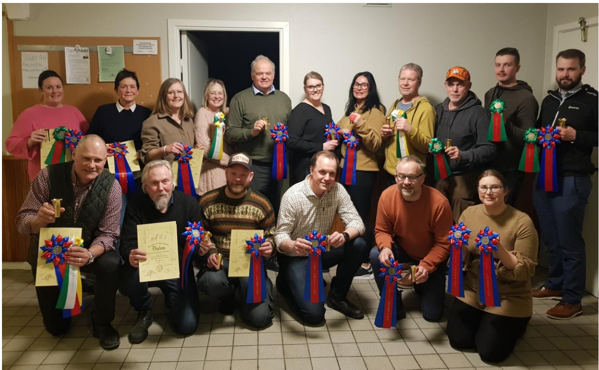
Utdelade championat, foto Annika Forsberg