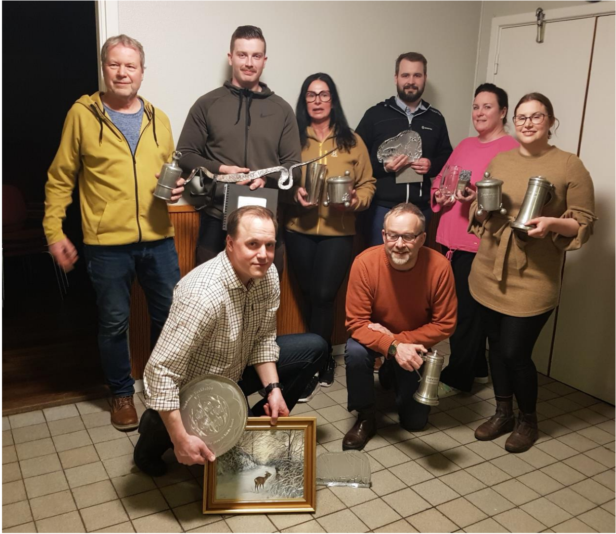
Avel- och vandringspriser